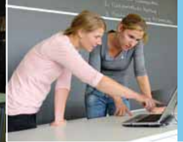
▲ L'enseignement et la collaboration avec les étudiants plaisent beaucoup à l'agronome.