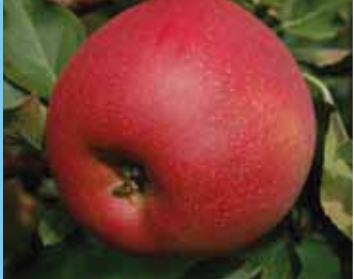
La pomme sucrée résistante à la tavelure «Galiwa» d'Agroscope