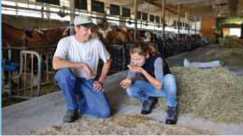
L'odeur du fourrage (ici ensilage de maïs) est un indicateur de qualité.