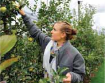
Dès que les nouvelles variétés portent leurs premiers fruits, ils sont récoltés et évalués: des propriétés importantes telles que la taille, la couleur, la forme, l'état de maturité et les composants sont relevées.