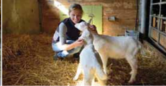
Les jumeaux ne sont pas rares chez les chèvres. Les jeunes animaux reniflent avec curiosité.